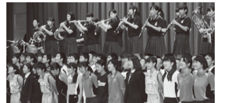
文化祭での校歌斉唱

八潮南高校は、普通科・商業科・情報処理科の3つの学科があります。商業関係の検定では高い合格率を出しています。また、毎年高い就職率を誇り、先生方がとても熱心です。八潮南高校は「校歌を大きい声で歌える学校」です。校訓である「勉学・誠実・実行」をもとに、八潮高校と一緒に活気ある八潮の誇りになる学校を目指します。