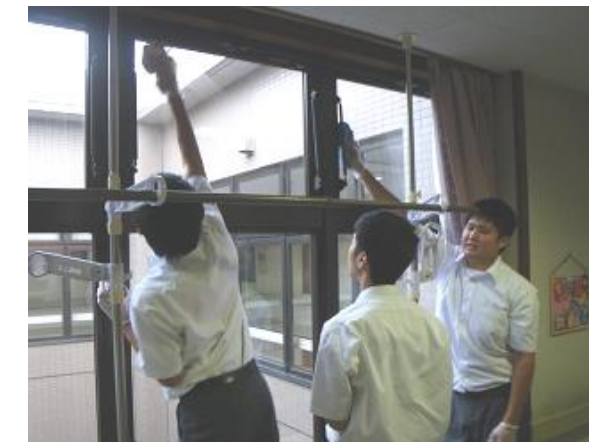
↑ やしお苑での活動(ボランティア部)