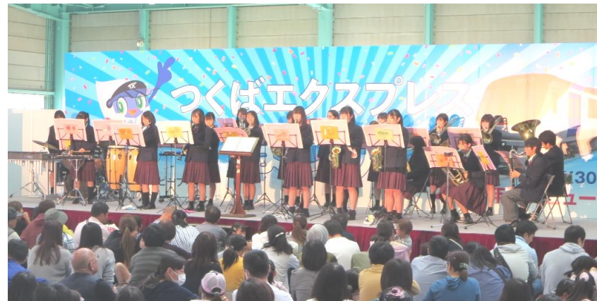
↑ つくばエクスプレスまつりの様子(吹奏楽部)